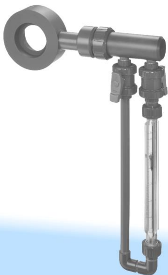
Рисунок 1 Диафрагменный расходомер F O N4